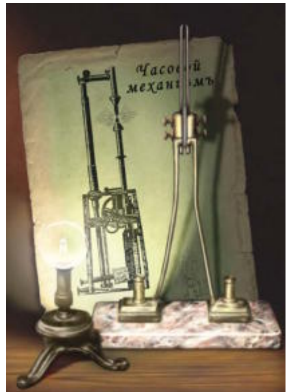
Рис. 1. Свеча Яблочкова.

Все задачи современного мира — комплексы, цепочки, клубки противоречий. Представьте себя изобретателем, которому удалось придумать лампочку «неперегорающую». Обычную лампу накаливания, но со сроком службы 100 лет.