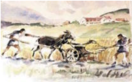
Рис. 2. Галльская очесывающая жатка.

подгоняемый сзади; вырванные колосья падают в раму».