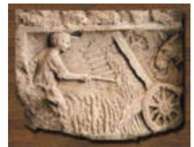
Рис. 3. Барельеф с изображением жатки.

Галлия накануне первого века нашей эры представляла собой обширную территорию, на которой проживало множество разрозненных кельтских племен – аквитаны, арверны, белги, галлы, секваны, эдуи и др. Общественный строй