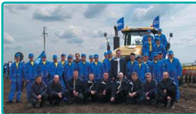
Рис. 5. Команда «ИНТЕКО-Агро». Первые «ноутильщики» России

«Весь порядок в каждой стране – политический, гражданский, всякий – всегда связан с почвой и с характером землевладения в стране. В каком характере сложилось землевладение, в таком характере сложилось и все остальное. Если есть в чем у нас в России наиболее теперь беспорядка, так это во владении землей, в отношении владельцев к ра-