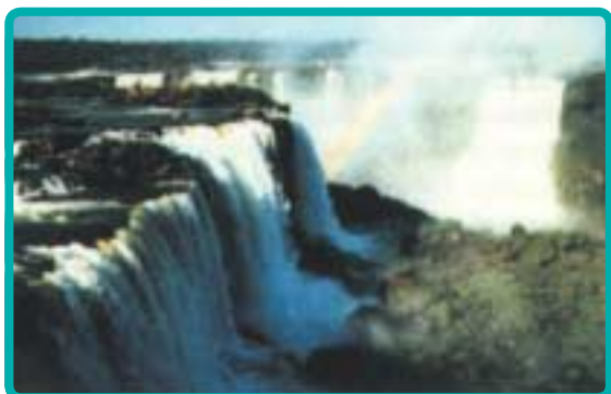
Рис. 4. Речной поток разных сезонов перед и после применения нулевой обработки (Игуассу, Бразилия) [10]