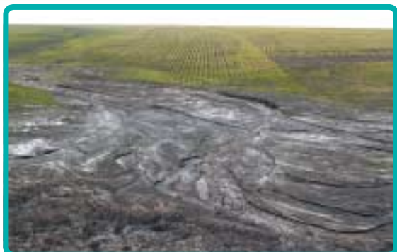
Рис. 3. Водная эрозия

различных размеров. Вначале недостаток механического смешивания снижает уровень разложения органических веществ, но за трех-, пятилетний период происходит адаптация биологической фракции почвы к новым условиям и процесс образования гумуса усиливается, качество почвы улучшается, ее плодородный слой растет, увеличивается продуктивность и соответственно капитализация почвы.