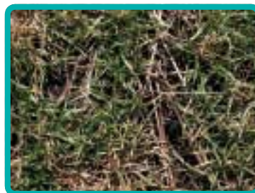
Рис. 1. No-till способствовал получению нормальных всходов (опыт ИНТЕКО-Агро, Белгородская область)