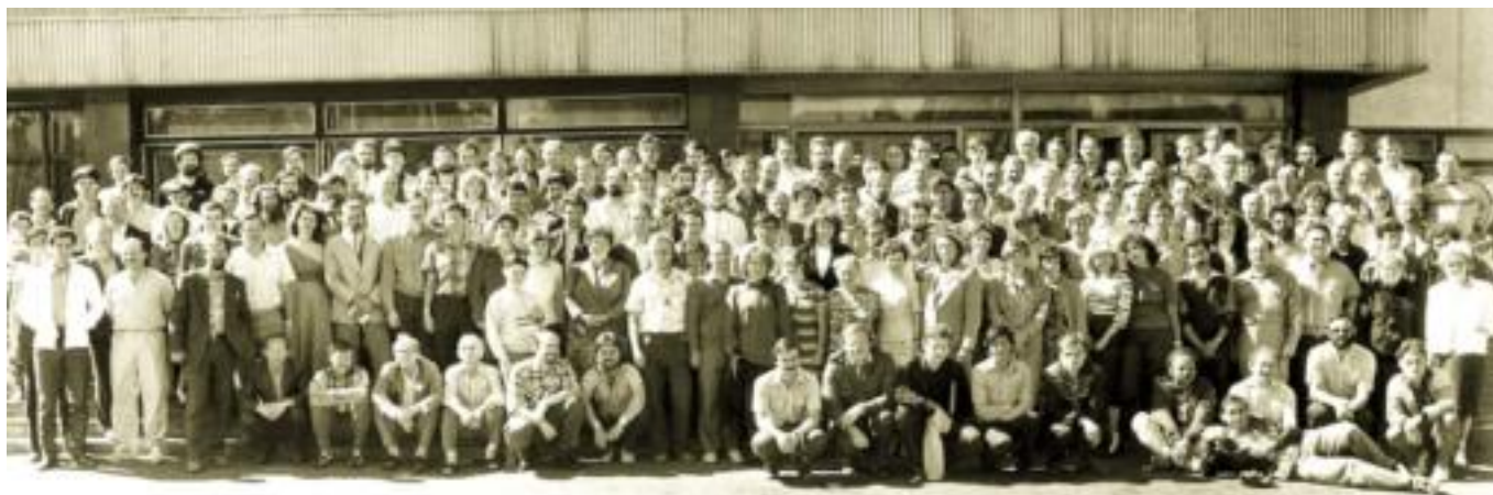
1989 год, город Петрозаводск – на съезд Ассоциации ТРИЗ собрались ученики Г. С. Альтшуллера. Сегодня благодаря их усилиям о ТРИЗ знает вся планета.