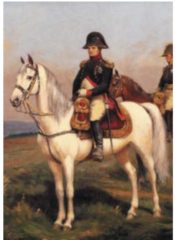
Наполеон обычно избегал белых коней. Но художники упорно изображают его именно на белом коне.

Бонапарт, прибыв в армию, резко повел борьбу с воровством. Солдаты это сейчас же заметили, и это помогло восстановлению дисциплины. Но ждать, пока армия будет экипирована, он не стал – ведь